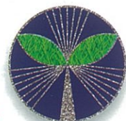
厚生会シンボルマーク

毎日暑い日が続きますが、皆さまいかがお過ごしでしょうか。サッカーワールドカップでは、8年ぶりの決勝トーナメント進出を決め、日本中が熱狂の渦に包まれました。西野監督就任後あまり日がない中、選手たち全員が一丸となり、格上相手に勝利するなど素晴らしい結果を残してくれました。惜しくも初のベスト8進出とはいきませんでしたが、国民に元気と感動を与えてくれたように感じます。この後も、熱中症には気を付けていただき、夏休み中は厚生会の各種セミナー等に参加し、リフレッシュしていただけたらと思います。(担当 大野)